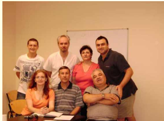
Fostul comitet de conducere al asociației.