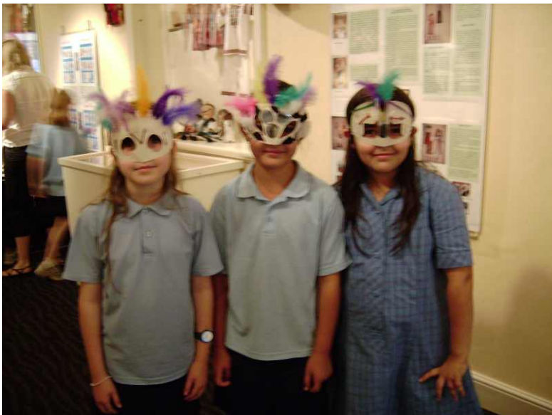
Grup de elevi de la Aberfoyle primary School cu masti facute la muzeu