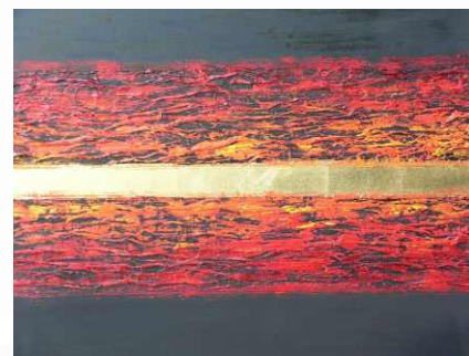
Between Dreams II