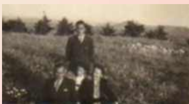
Nelu înainte de plecare, eu și părinții

Era să emigrăm în Australia cu toată familia-adică eu și cu părinții mei fiindcă fratele meu plecase mai înainte și era deja stabilit în Australia. Venise aici la vârsta de 17 ani fără să cunoască limba engleză și fără nici un prieten sau cunoscut. La început a fost exploatat de un om bogat care avea o fabrică de tutun în Queensland, și care îl plătea foarte puțin și îl punea să lucreze și weekend-urile acasă la el: să-i sape în grădină, să-i facă cumpărăturile, să-i curețe casa și așa mai departe. Se purtau frumos cu el și el și soția lui însă îl foloseau ca un sclav. Necunoscând pe nimeni în țara asta el nu putea apela la nimeni și a suferit destul în primii doi-trei ani.