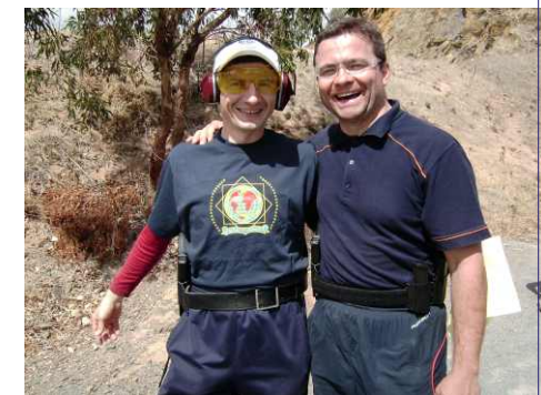
Fotografii din poligonul de la McLaren Vale