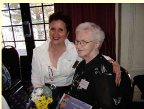
Poze de la festivitatea de premiere