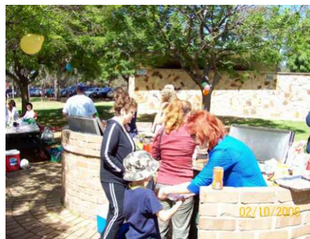
Iar la gratare