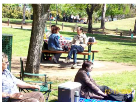
Toata lumea se relaxeaza