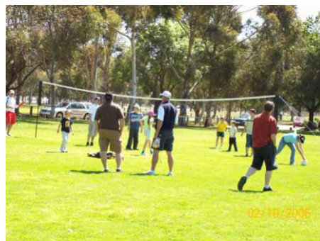
Se joaca volei