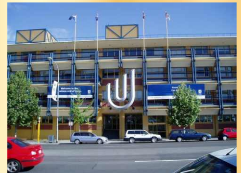
University of South Australia