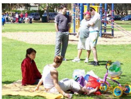
Discutii ca intre barbati