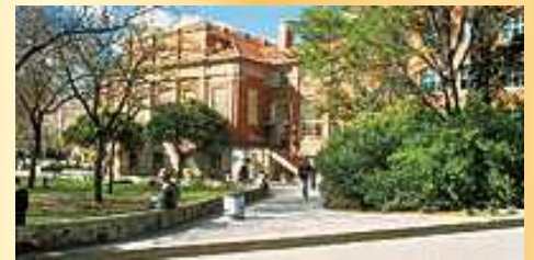
University of Adelaide