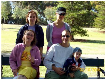
Poze cu noi veniti