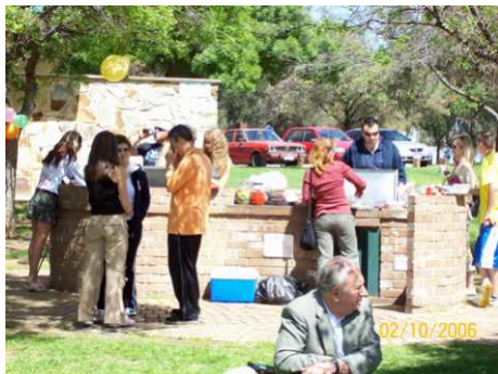
In asteptarea gratarelor